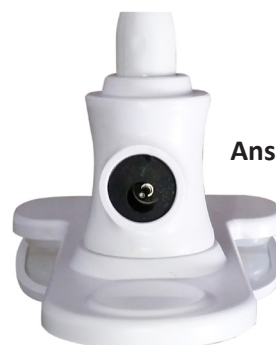
Anschluss für Netzteil